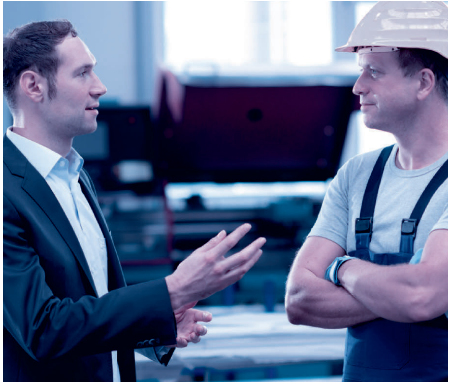
Das Mitarbeitergespräch ist keine Nebensache. Nehmen Sie sich Zeit und hören Sie zu.

Sinnvollerweise wird für das Mitarbeitergespräch zudem ein über die Jahre gleichbleibender Beurteilungsbogen mit einer Bewertungsskala (mit Smileys, Ampeln, Zahlen oder Buchstaben) verwendet.